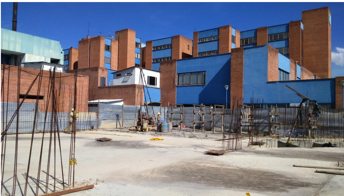
Nivel +0.00 Hospital Occidente de Kennedy